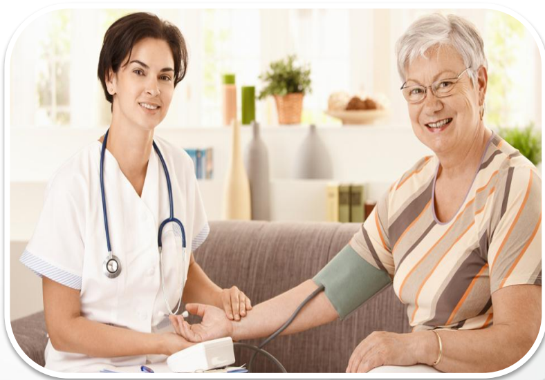
Gerenciamento das principais doenças crônicas (Hipertensão, Diabetes, Dislipidemia e Obesidade)